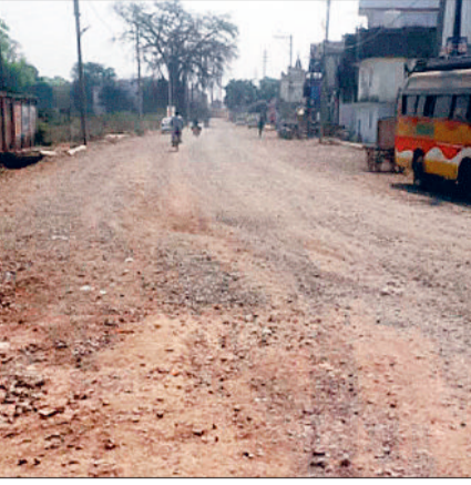
टूटने लगा भरोसा

उल्लेखनीय है कि पिछले दिनों नगरवासियों सड़क निर्माण को लेकर चार घंटे तक चक्काजाम किया था। इस दौरान कहा गया कि कार्य सितंबर अक्टूबर तक पूरा हो जाएगा, लेकिन सड़क पर गिट्टी बिछाकर छोड़ दिया गया है जिसके कारण आए दिन दुर्घटना हो रही है। आमजन धूल की गुबार से परेशान हैं।