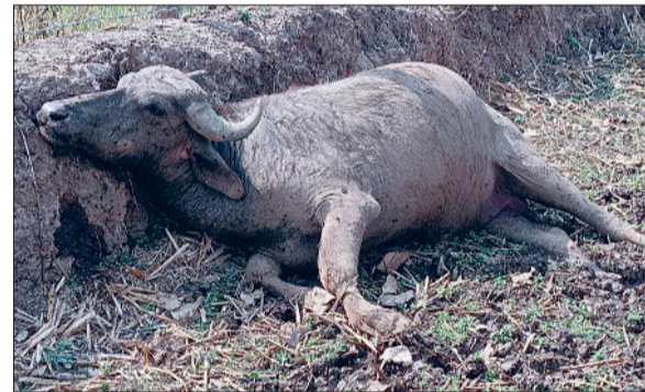
चपेट में आकर लगातार पशुधन की मौतें हो रही हैं। स्थानीय लोगों ने पहले ही युवक को इस बारे में आगाह करते हुए विद्युत करंट लगाने से मना किया था लेकिन उसने ग्रामीणों की हिदायत पर ध्यान नहीं दिया। बताया गया कि विगत 8 अप्रैल को फिर से खेतों में लगे

पंडरिया थानांतर्गत आने वाले समीपस्थ ग्राम खेरडोंगी में फसल सुरक्षा के लिए लगाए गए विद्युत करंट की चपेट में आने से अनेक गौधन की मौत को लेकर लोगों में आक्रोश है। बजरंग दल ने दोषी व्यक्ति के खिलाफ कड़ी कार्यवाही की मांग की है। स्थानीय ग्रामीणों से मिली जानकारी के अनुसार ग्राम खेरडोंगी में एक युवक द्वारा अपने खेत में धान की फसल के चारों ओर लगाए गए जाली तार में विद्युत करंट प्रवाहित किए जाने से उसकी