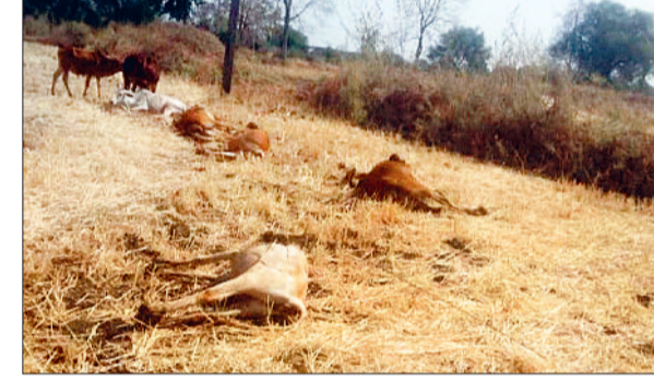
बड़ी घटना टली