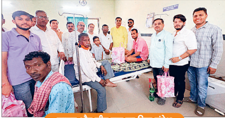
मानव और जीव दया का दिया संदेश

पाश्र्वनाथ महिला मंडल, सुधर्म महिला मंडल, समरथ महिला मंडल, महावीर मित्र मंडल व यूथ क्लब द्वारा स्वामी वाल्म्यबाद दोपहर दो बजे के बाद स्वाध्याय, सामायिक व आराधना का कार्यक्रम हुआ और शाम चार बजे भारतीय जैन संघटना के संयोजन में खेल खेल में सीखें जैन धर्म की स्पर्धा हुई। इससे पहले सकल जैन श्री संघ के बैनर तले सप्ताह भी विविध आयोजन कर लोगों की सेवा की गई। गौशालाओं की गौ सेवा, अस्पताल में भर्ती मरीजों को फल सहित आवश्यक सामानों का किट दिया गया। जिन धर्म की महिमा, वर्तमान में वर्धमान की आवश्यकता विषय पर परिचर्चा सहित विश्व नवकार दिवस सहित संयम पथ के साधकों का अभिनंदन किया गया। भगवान महावीर के जन्म जयंती के दिन समाज ने व्यावसायिक प्रतिष्ठानों को पूरी तरह से बंद रखा था।